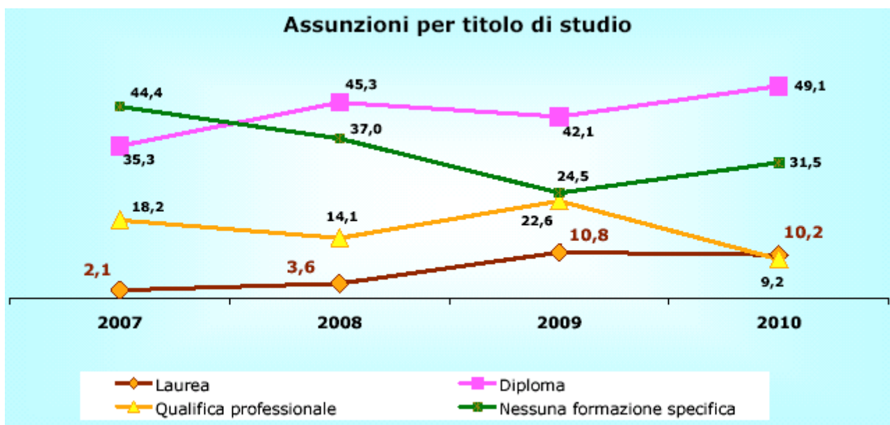
Figura 2 - Titoli di studio richiesti dalle imprese

Un'attenzione particolare va posta sui titoli di studio richiesti dalle imprese: nel 2010, le entrate previste di personale in possesso di un titolo universitario rappresentano a Pistoia il 10,2%. Il diploma è richiesto nel 49,1% dei casi, mentre per il 9,2% è richiesta una qualifica. Resta un 31,5% delle assunzioni previste per cui non è richiesta formazione specifica.